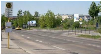
Pablo-Picasso-Straße / Zu den Krugwiesen

Das Gewerbegebiet ist Bestandteil des Entwicklungskonzeptes für den produktionsgeprägten Bereich in Berlin (EpB) und wurde mit Fördermitteln aus der Gemeinschaftsaufgabe „Verbesserung der regionalen Wirtschaftsstruktur“ (GRW) erschlossen. Der Standort eignet sich für kleinere und größere Betriebe mit gebietsübergreifendem Absatz. Für die Flächen besteht gesichertes Planungsrecht mit den Bebauungsplänen XXII-1a und XXII-38.