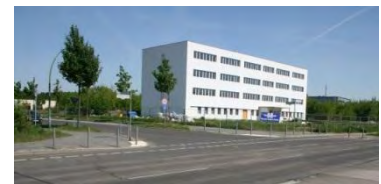
Neu hergerichtetes Bürogebäude