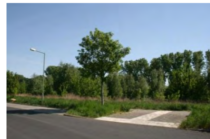
Erschließungsstraße Graaler Weg