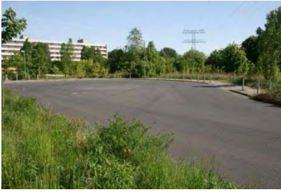
Wendehammer Graaler Weg

Das Gewerbegebiet ist Bestandteil des Entwicklungskonzeptes für den produktionsgeprägten Bereich in Berlin (EpB) und wurde mit Fördermitteln aus der Gemeinschaftsaufgabe „Verbesserung der regionalen Wirtschaftsstruktur“ (GRW) erschlossen. Der Standort eignet sich für kleinere und größere Betriebe mit gebietsübergreifendem Absatz. Für die Flächen besteht gesichertes Planungsrecht mit dem Bebauungsplan XXII-2a.